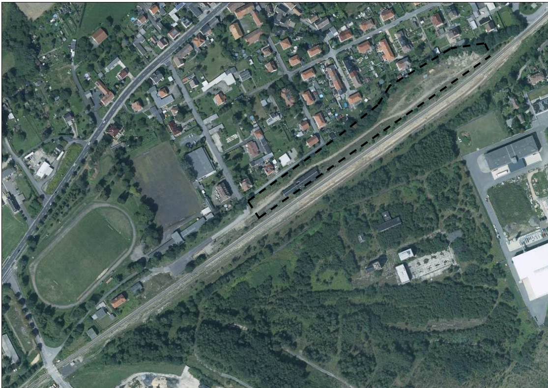
Abb.2: Luftbild, mit Eintragung Geltungsbereich