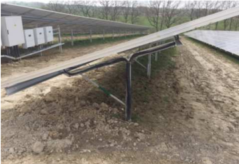
Abb.3: Darstellung der geplanten Tischkonstruktion (während der Bauphase)

Es sollen Photovoltaikmodule mit einer reflexionsarmen Oberfläche zum Einsatz kommen, die für die Freilandaufstellung geeignet sind. Die Solarzellen bestehen aus Silizium und liegen hinter einer Schutzverglasung aus gehärtetem Glas, die in einem Aluminium-Rahmen als Modul gefasst sind. Die Module werden als String elektrisch in Reihe geschaltet und parallel zum Wechselrichter geführt.