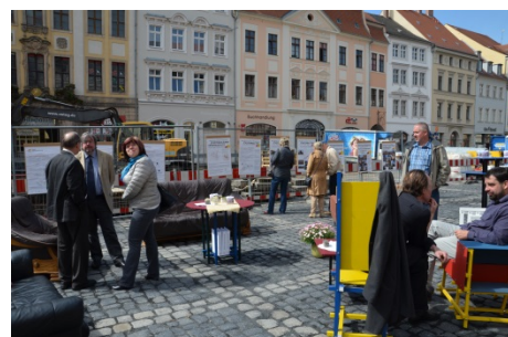
Abbildung 1 Bürgerinformationsveranstaltung

Diese Träger und Institutionen beteiligen sich durch die Umsetzung von Maßnahmen aktiv am Gesamtvorhaben oder passiv durch die Bereitstellung von Daten, Konzeptionen oder die Anpassung der eigenen strategischen Ausrichtung.